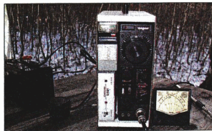
Eingesetzte Technik auf der Katzenburg (DL/TH-084) am 18.12.2004

Nach dem großen Erfolg der SOTA-Winterwanderung mit über 20 Aktivierungen in sechs Bundesländern sind 2005 für jede Jahreszeit Wandertage geplant. Der Frühjahrswandertag findet am 26./27.3., der Sommerwandertag am 11./12.6., der Herbstwandertag am 10./11.9. und der Winterwandertag am 17./18.12.2005 statt. Der Wandertag am 11.6. wird gleichzeitig als Aktivitätstag gewertet, eine Veröffentlichung der Ausschreibung soll laut SOTA-DL Deutsche Mittelgebirge noch erfolgen. Aktivitätszentren sind die QRP-Frequenzen auf